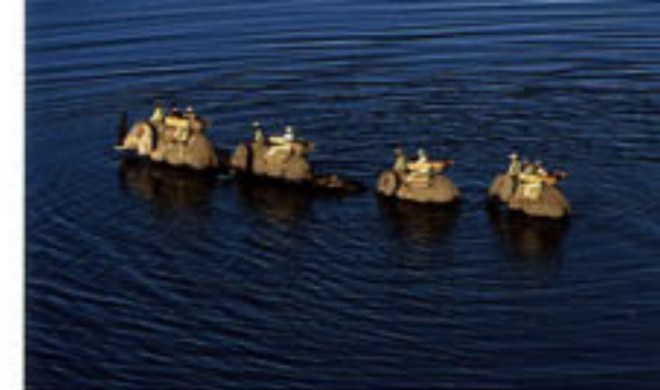
Elefanten können schwimmen. Lagunadurchquerung auf dem Rücken der Dickhäuter, aus dem Flugzeug fotografiert

Am Horizont nagen Giraffen an den Ästen einiger Leberwurstbäume, eine Herde Büffel grasht unmittelbar vor uns. Sie schauen uns verwundert an und fressen weiter. Für sie sind wir seltsame Beulen auf Elefanten, jedenfalls keine Bedrohung. Auf dem Rücken der Elefanten werden wir Teil der Wildnis. Die Dickhäuter nehmen