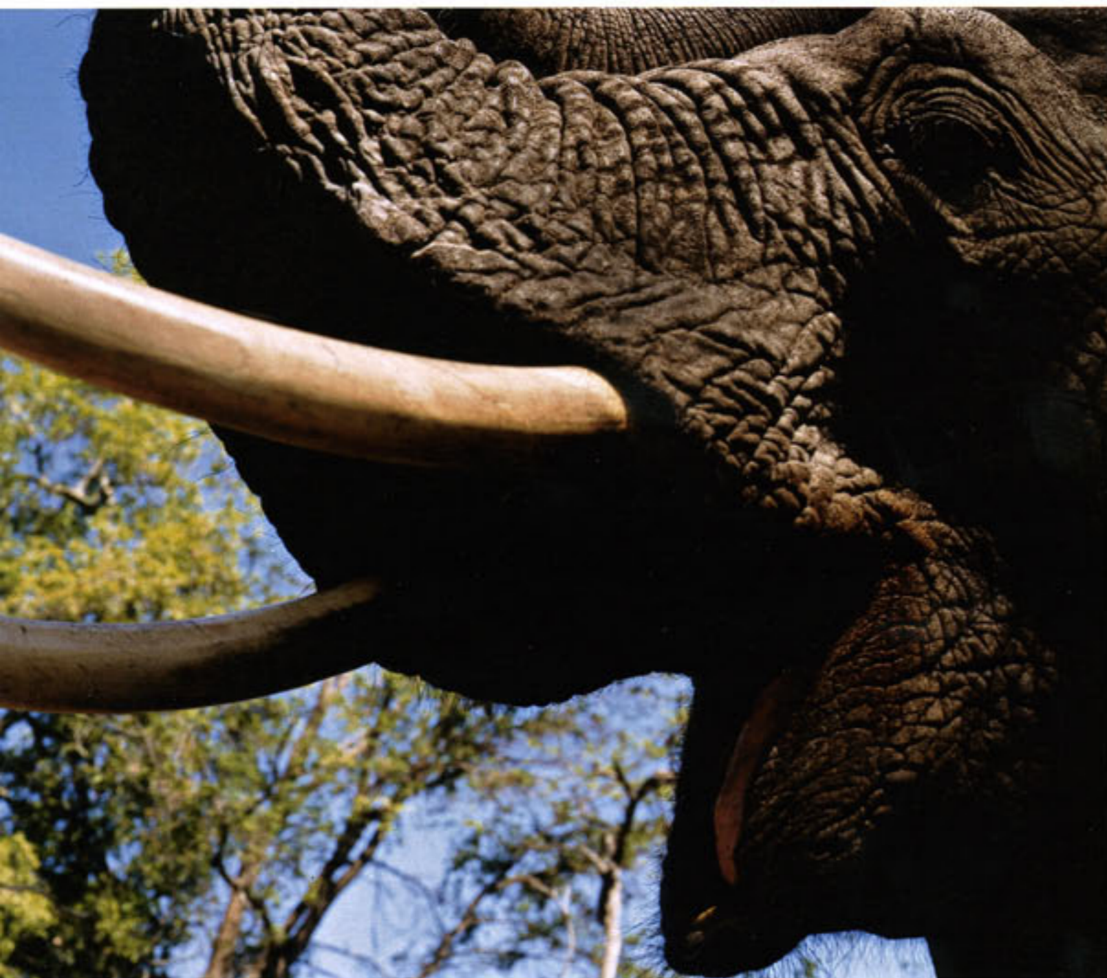
Afrikanische Elefanten sind die größten Landsäugetiere der Welt. Sie wiegen bis zu vier Tonnen