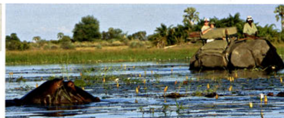
Das Flusspferd verteidigt sein Revier und tötet jeden Konkurrenten. Nur Elefanten duldet es