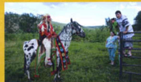
Bizarre Folklore: Die jungen Nez Percé finden die Traditionen ihrer Ahnen nur skurril