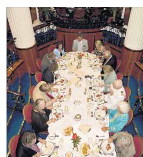
Captain's Dinner: Es ist eine Ehre, zum Tisch des Kapitäns gebeten zu werden.