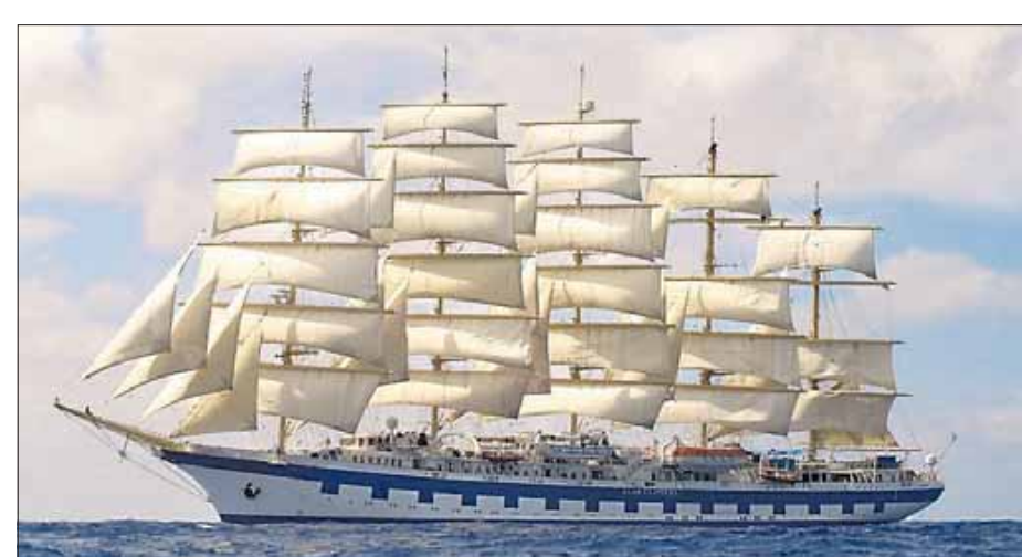
Die „Royal Clipper“ unter Vollzeug: 5050 Quadratmeter verteilen sich auf 42 Segel, jedes hat einen Namen. Das Kreuz-Obermarssegel fehlt, es wird repariert.