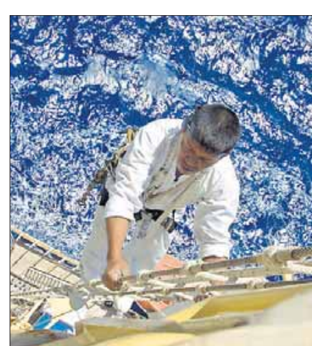
Auf dem Weg nach oben: Von Rah zu Rah werden die Wanten steiler.