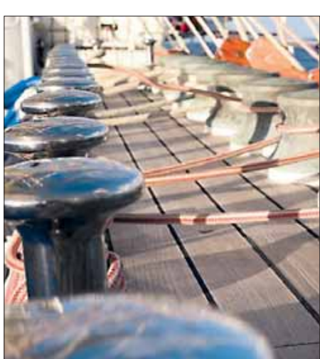
In Reih' und Glied stehen die Krampen, auf denen die Schoten belegt werden.